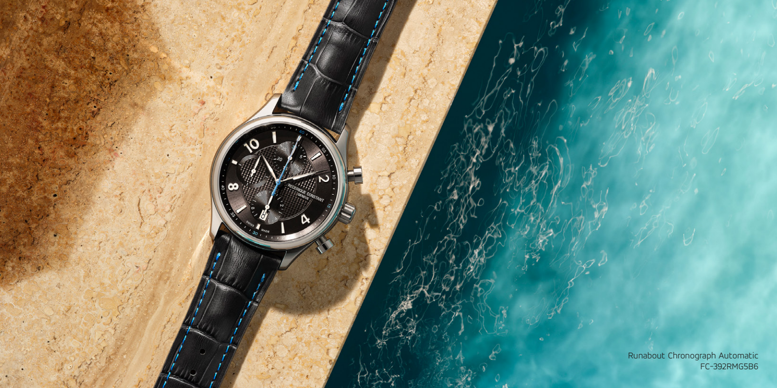
Runabout Chronograph Automatic FC-392RMG5B6