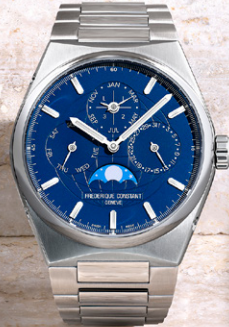
Highlife Perpetual Calendar Manufacture FC-775N4NH6B