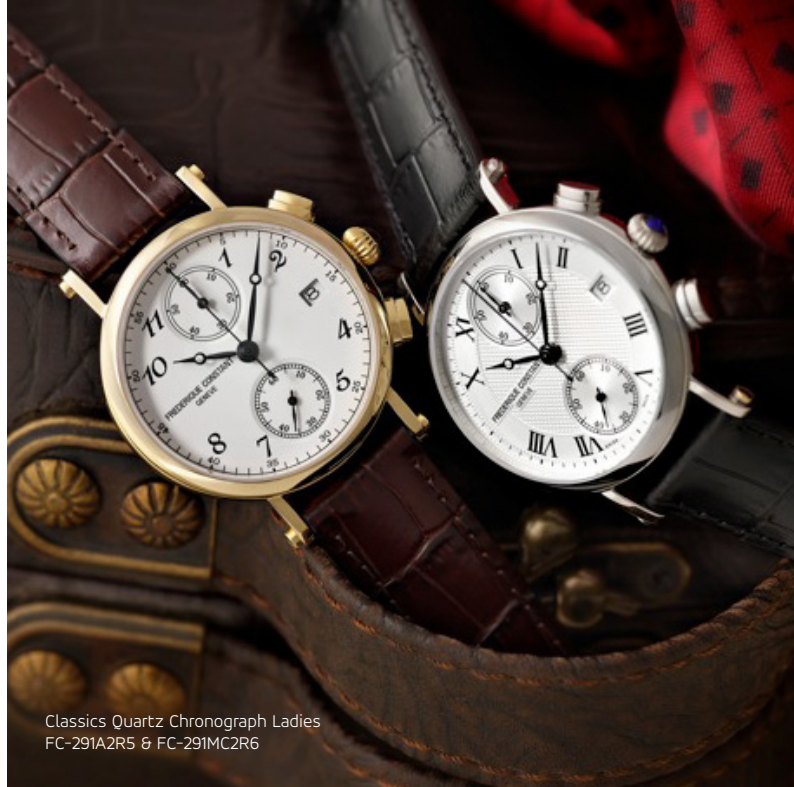
Classics Quartz Chronograph Ladies FC-291A2R5 & FC-291MC2R6