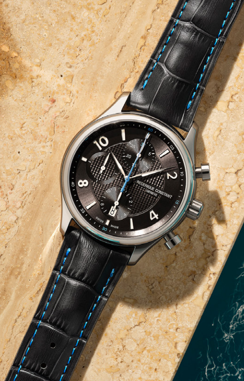
Runabout Chronograph Automatic FC-392RMG5B6