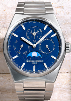
Highlife Perpetual Calendar Manufacture FC-775N4NH6B