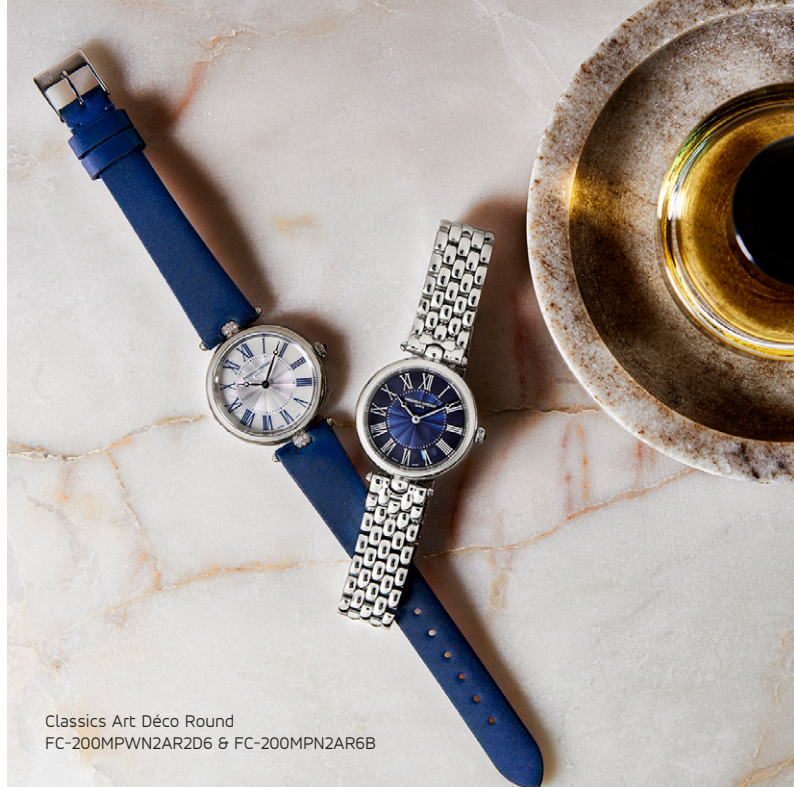
Classics Art Déco Round FC-200MPWN2AR2D6 & FC-200MPN2AR6B