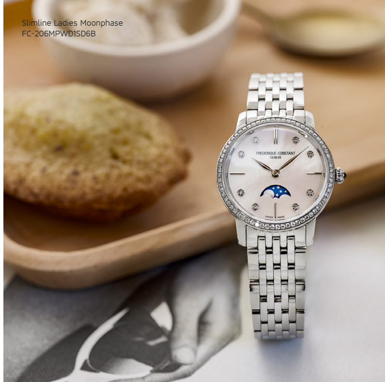
Slimline Ladies Moonphase FC-206MPWD1SD6B