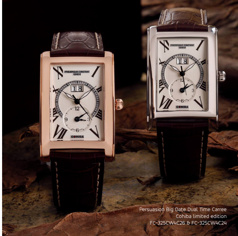
Persuasion Big Date Dual Time Carree Cohiba limited edition FC-325CW4C26 & FC-325CW4C24